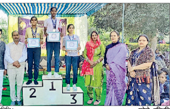
रेवाड़ी। विजेताओं को पुरस्कृत करते हुए अतिथि।