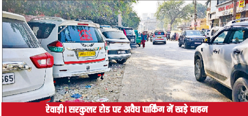
रेवाड़ी। सरकुलर रोड पर अवैध पार्किंग में खड़े वाहन

विभागों में तालमेल की कमी के कारण समस्या ज्यों की त्यों बनी