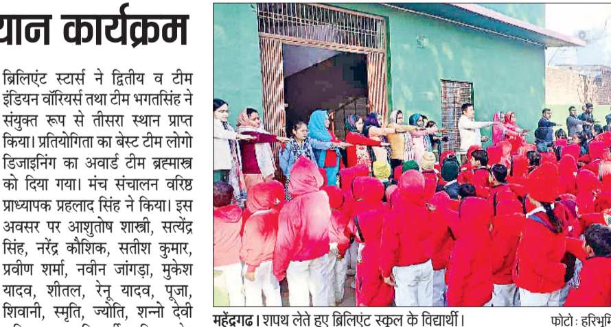
महेंद्रगढ़। शायप लेते हुए ब्रिलिएंट स्कूल के विद्यार्थी।