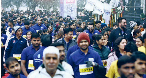
रेवाड़ी। हॉफ मैराथन में भाग लेते हुए जिलावासी।

इसके अलावा जीएम के नाम सौंपे दूसरे ज्ञापन में बताया कि उपतहसील मुख्यालय सतनाली हरियाणा व राजस्थान के 80 सैनिक बाहुल्य गांवों का मुख्य रेलवे स्टेशन है और यहां से प्रतिदिन भारी संख्या में यात्री यात्रा करते हैं। स्टेशन पर कुछ ही ट्रेनों का ठहराव है। जिनसे उल्लेखनीय यात्री भार के बावजूद अनेक एक्सप्रेस ट्रेनों का ठहराव नहीं दिया गया है। जिससे यात्रियों को परेशानी का सामना करना पड़ रहा है। ज्ञापन में ट्रेन नंबर 22471/72 दिल्ली लालगढ़-इंटरसिटी, ट्रेन नंबर 19701/02, दिल्ली-सरायरोहिल्ला-जयपुर सैनिक एक्सप्रेस व ट्रेन नंबर 14713/14 दिल्ली सराय-सीकर एक्सप्रेस का ठहराव करने की मांग करते हुए बताया कि इन ट्रेनों के ठहराव से यात्रियों को सुविधा मिलेगी और रेलवे को भी अतिरिक्त राजस्व की प्राप्ती होगी। उन्होंने बताया कि ज्ञापन की प्रति सांसद चौधरी धर्मवीर सिंह, महाप्रबंधक उत्तर रेलवे नई दिल्ली व मंडल रेल प्रबंधक बीकानेर को भी प्रेषित की गई है।