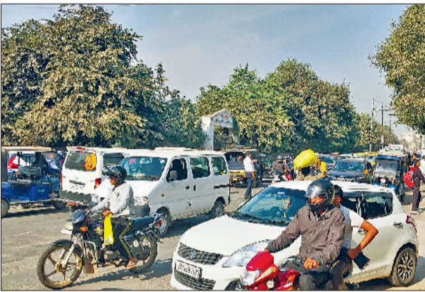
रेवाड़ी। सरकुलर रोड पर लगा वाहनों का जाम।

ट्रांसपोर्टों की ओर से फड़ों से अपनी बसें हटा ली जाती हैं तथा फसल का सीजन जाते ही फड पर फिर से बसें खड़ी करके कब्जा कर लिया जाता है। प्रशासन की ओर से अवैध पार्किंग को लेकर सड़कों पर व्यवस्था सुधारने के लिए कोई ठोस कदम नहीं उठाए जा रहे हैं, जिससे शहर में व्यवस्था बिगड़ती जा रही है। शहर में पार्किंग के स्थान नहीं होने के कारण भी लोगों को मजबूरन सड़कों पर वाहनों को खड़ा करना पड़ रहा है।