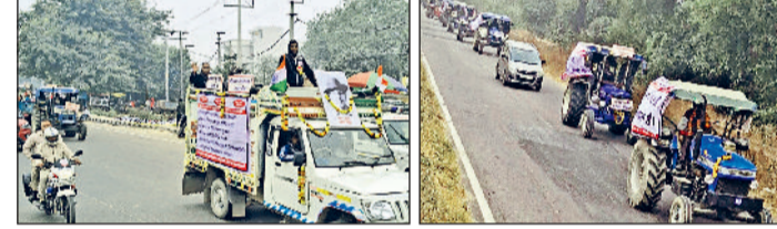
रेवाड़ी। अस्पताल की मांग को लेकर ट्रैक्टर मार्च निकालते ग्रामीण।

शहर वासियों व ग्रामीणों ने ट्रैक्टर मार्च को अपना पूर्ण समर्थन दिया। मीरपुर में शहीद भगत सिंह की प्रतिमा पर माल्यापण करके श्रद्धांजलि दी गई।