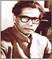
-हरिवंश राय बच्चन

हरना तब आवश्यक हो जाता है, जब लड़ाई अपनों से हो, और जीतना तब आवश्यक हो जाता है, जब लड़ाई अपने आप से हो।