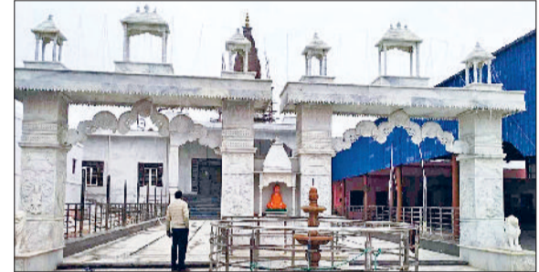
महेंद्रगढ़। बाबा जयराम दास का मंदिर।

बता दें कि गांव पाली में हर वर्ष बाबा जयराम दास का मेला का आयोजन किया जाता है। इसी उपलक्ष्य में जिले में यहां सबसे बड़ी क्रिकेट प्रतियोगिता होती है। इस क्रिकेट महाकुंभ में देशभर से अनेक क्रिकेटर खिलाड़ी हिस्सा ले चुके हैं। पाली के इस खेल स्टेडियम में 2007 में हुए 20-20 क्रिकेट वर्ल्डकप मुकाबले में इंडिया टीम को जीत दिलाने वाले