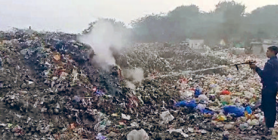
रेवाड़ी। कूड़े के ढेर में लगी आग पर काबू पाते दमकलकर्मी।

यहां कूड़े के अंबार लगे हुए हैं। कूड़े में आग लगने के बाद प्रदूषण की समस्या बढ़ती है। शनिवार की शाम भी किसी ने कूड़े में आग लगा दी। फायर ब्रिगेड की गाड़ी ने मौके पर जाकर आग पर काबू पाया। इनलैंड कंटेनर डिपो के पास एचएसवीपी की खाली जमीन पड़ी हुई है। इस जमीन पर कबाड़ियों से लेकर शहर तक का कचरा डाला जा रहा है। इस बेशकीमत जमीन को लंबे समय से अस्थाई डॉंपिंग स्टेज के रूप में इस्तेमाल किया जा रहा है। इस समय एचएसवीपी की जमीन पर भारी मात्रा कचरा पड़ा हुआ है। शनिवार की शाम