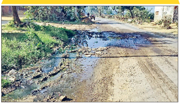
रेवाड़ी। गांव कटू भवानीपुरा में मुख्य सड़क पर बने गड्ढे में जमा गंदे पानी।