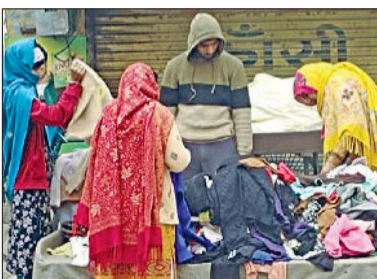
रेवाड़ी। बावल चौक के पास गर्म कपड़े खरीदती महिलाएं, रविवार सुबह कोहरे में लिपटी नई अनाजमंडी तथा बाईपास से कोहरे में लाइट जलाकर गुजरते वाहन।

रविवार को सुबह से ही घना कोहरा छाया रहा। कोहरे की विजिबिलिटी 500 मीटर तक रही। सड़कों पर वाहनों की रफ्तार मंद पड़ गई। नेशनल हाइवे पर वाहन चालक दिन में भी लाइटें जलाकर एक-दूसरे के पीछे चलते हुए नजर आए। अभी तक दिन के समय आसमान साफ रहने के कारण लोगों को सूरज की तपिश का सामना करना पड़ रहा था।